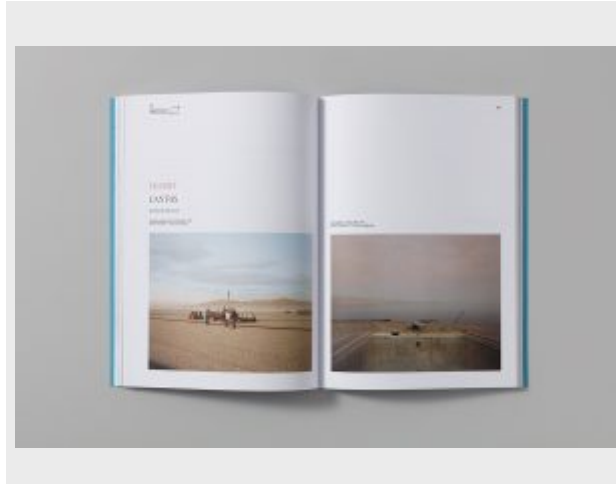
Portfolio, « Desert Cantos » de R. Misrach, Reliefs n°5.

Jeanne Baret...), de présentations d'archives photographiques ou de gravures (Edward Sheriff Curtis et les amérindiens au début du XX e siècle, les croquis de voyage de Louis de Freycinet...). On trouve ensuite un extrait assez long d'une œuvre littéraire (Jules Verne, Henry Morton Stanley, Herman Melville, ...).