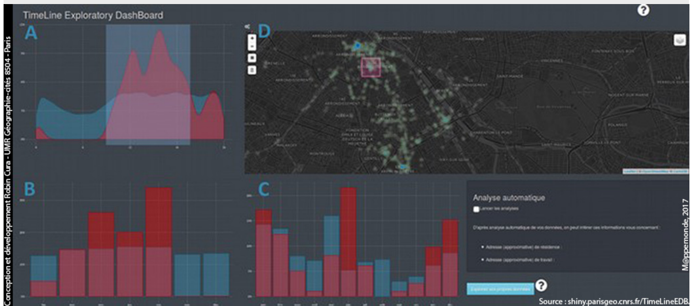
Figure 1. Copie écran de l'interface TimeLineEDB.

Cette application, TimeLineEDB ( figure 1 ), s'appuie sur des technologies libres 2 organisées autour du langage d'analyse de données R (R Core Team, 2016). Elle fait en particulier un large usage du package « shiny » (Chang et al. , 2017), qui permet la création d'interfaces graphiques dynamiques web.