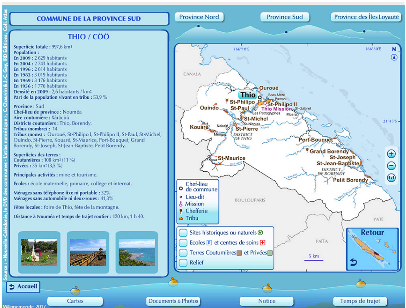
Figure 2. Fenêtre de présentation des communes.