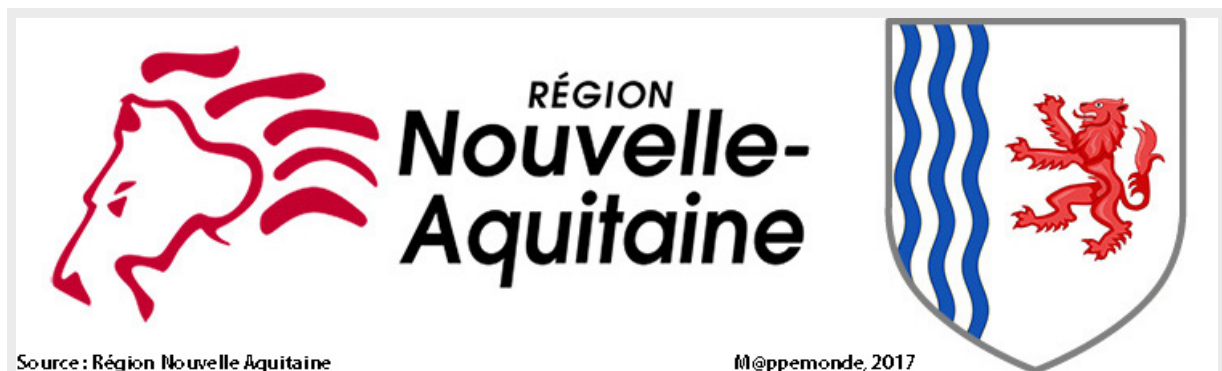
Figure 1. Le logo et le blason de la région Nouvelle-Aquitaine.