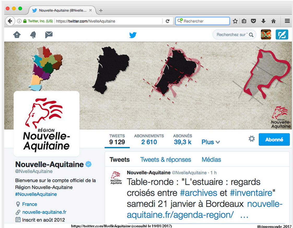
Figure 4. Capture d'écran du compte Twitter de la Nouvelle-Aquitaine.

Cependant, l'indélicatesse de la vidéo n'a pas échappé aux Présidents des Conseils départementaux des Deux-Sèvres et de la Vienne qui dans un communiqué de presse commun fustigent ce tracé et en profitent pour polémiquer : « Nous ne pouvons imaginer qu'il soit l'expression d'une vision centralisatrice de l'instance régionale, ou d'une volonté délibérée d'exclure les territoires les plus éloignés de la capitale bordelaise. (...) Nous formulons le vœu que les modalités d'intervention de la Région sur le territoire régional ne s'inspirent pas de ce découpage pour le moins maladroit » 3 .