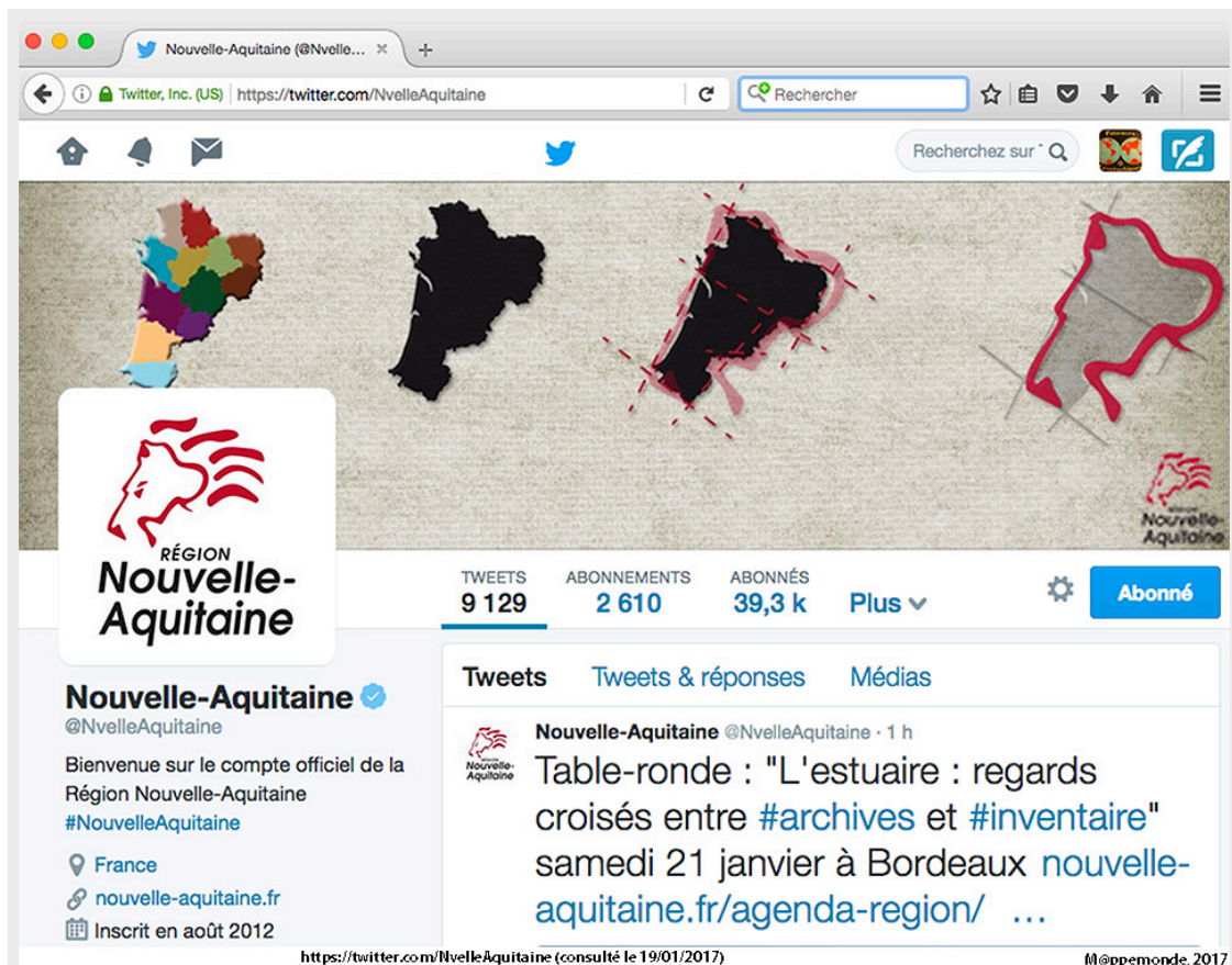
Figure 4. Capture d'écran du compte Twitter de la Nouvelle-Aquitaine. Source : https://twitter.com/NvelleAquitaine (consulté le 19/01/2017).

Cependant, l'indélicatesse de la vidéo n'a pas échappé aux Présidents des Conseils départementaux des Deux-Sèvres et de la Vienne qui dans un communiqué de presse commun fustigent ce tracé et en profitent pour polémiquer : « Nous ne pouvons imaginer qu'il soit l'expression d'une vision centralisatrice de l'instance régionale, ou d'une volonté délibérée d'exclure les territoires les plus éloignés de la capitale bordelaise. (...) Nous formulons le vœu que les modalités d'intervention de la Région sur le territoire régional ne s'inspirent pas de ce découpage pour le moins maladroit » 3 .