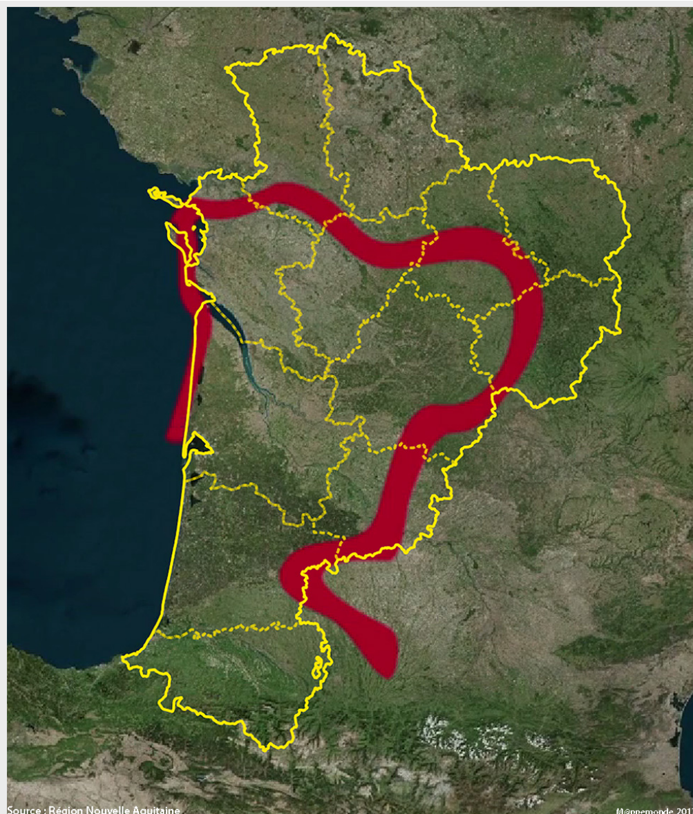
Figure 3. Confrontation entre le tracé stylisé du contour régional inspirant le logotype et les limites administratives de la région et des ses départements.

On peut supposer qu'il s'agit uniquement d'une erreur de communication lors de la réalisation de la vidéo promotionnelle puisque d'autres visuels présentent un emboîtement effectif des contours du logo avec les limites administratives. C'est le cas notamment du bandeau figurant sur le compte Twitter officiel de l'institution ( figure 4 ).