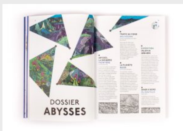
Ouverture du dossier « Abysses », Reliefs n°1.

La partie centrale de chaque volume se consacre au dossier thématique : Abysses , Tropiques , Pôles et Galaxies en 2016. Les dossiers sont composés de différentes contributions, croisant passé et présent, vulgarisation scientifique et littérature, texte et image. Les textes eux-mêmes sont de formes variées : interviews (de scientifiques, d'explorateurs, d'auteurs...), essais, extraits d'ouvrages, articles thématiques. On notera la grande qualité des illustrations à vocation infographique : coupes, descriptions détaillées, cartes et schémas. Le seul petit reproche que l'on puisse faire sur les représentations cartographiques concerne un défaut malheureusement courant aujourd'hui : les mappemondes sont généralement proposées en projection cylindrique, ce qui déforme très inutilement et injustement les surfaces terrestres aux hautes latitudes. L'angle artistique de chaque dossier est lui aussi très varié, avec la présence d'un portfolio de photographies, d'extraits littéraires, ainsi que de nombreuses illustrations qui jouent souvent un rôle intermédiaire : dessins, gravures ou photographies d'archives, actifs sur le plan esthétique comme sur celui de l'information scientifique.