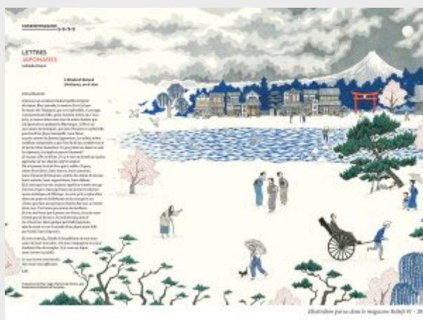
S. Thommen, illustration des « Lettres japonaises » de L. Hearn pour le n°1 de Reliefs.

Le numéro s'ouvre par une double page illustrée formant la rubrique « Correspondance ». Comme son nom l'indique, il s'agit d'un extrait de correspondance, daté du XIX e siècle, dont l'auteur, le sujet ou le contexte sont en lien avec le thème du numéro. Le texte partage l'espace de la double page avec une illustration originale. Le premier numéro, « Abysses », comprend, par exemple, un extrait des Lettres Japonaises de Lafcadio Hearn (1890), magnifiquement illustré par Sandrine Thommen dans le style des estampes d'Hokusai.