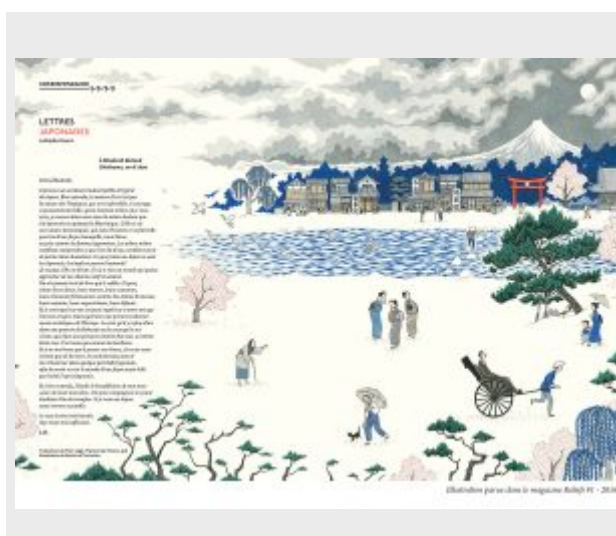
S. Thommen, illustration des « Lettres japonaises » de L.

Le numéro s'ouvre par une double page illustrée formant la rubrique « Correspondance ». Comme son nom l'indique, il s'agit d'un extrait de correspondance, daté du XIX e siècle, dont l'auteur, le sujet ou le contexte sont en lien avec le thème du numéro. Le texte partage l'espace de la double page avec une illustration originale. Le premier numéro, « Abysses », comprend, par exemple, un extrait des Lettres Japonaises de Lafcadio Hearn (1890), magnifiquement illustré par Sandrine Thommen dans le style des estampes d'Hokusai.