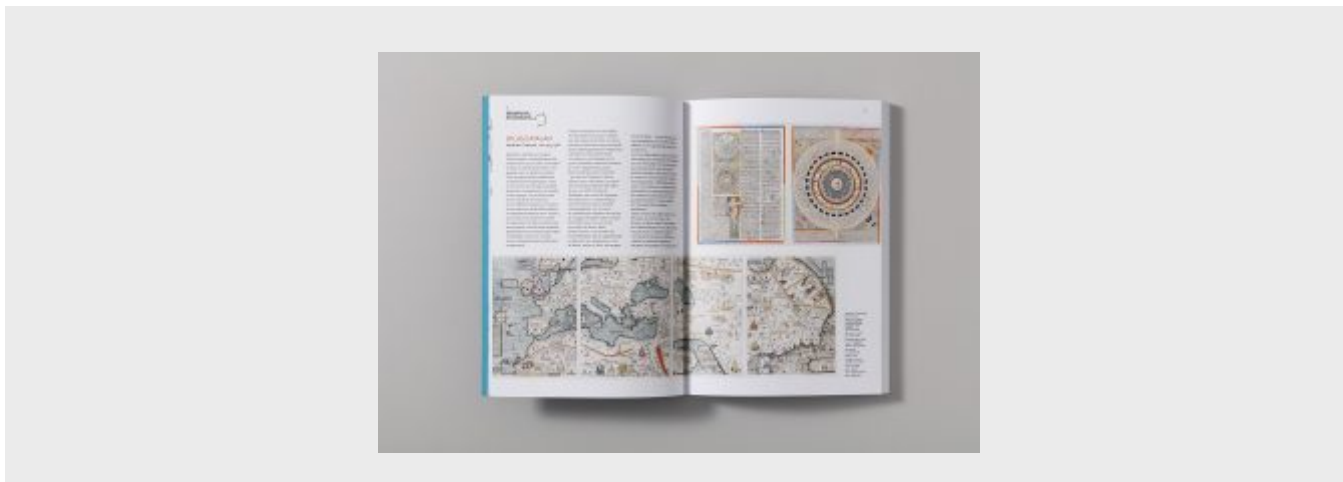
Présentation de l'Atlas Catalan (A. Cresques), dans Reliefs n°5.

Vient ensuite la rubrique « Géographie nostalgique », regroupant la reproduction de plusieurs cartes anciennes, présentées et décrites par un court texte. Ces cartes sont, pour certaines, aussi disponibles sous la forme de grande cartes dépliantes rééditées à part par la revue. C'est l'occasion de remettre à l'honneur d'importantes représentations anciennes, parfois méconnues (comme la superbe Carta Marina d'Olaus Magnus, imprimée pour la première fois en 1539, ou l' Atlas Catalan d'Abraham Cresques, 1375).