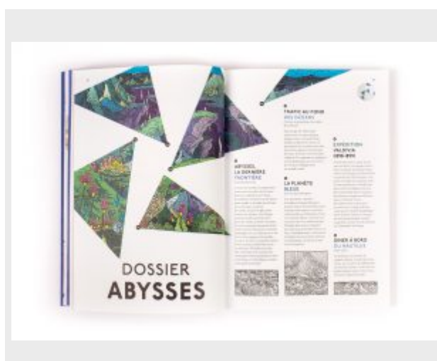
Ouverture du dossier « Abysses », Reliefs n°1.

La partie centrale de chaque volume se consacre au dossier thématique : Abysses , Tropiques , Pôles et Galaxies en 2016. Les dossiers sont composés de différentes contributions, croisant passé et présent, vulgarisation scientifique et littérature, texte et image. Les textes eux-mêmes sont de formes variées : interviews (de scientifiques, d'explorateurs, d'auteurs...), essais, extraits d'ouvrages, articles thématiques. On notera la grande qualité des illustrations à vocation infographique : coupes, descriptions détaillées, cartes et schémas. Le seul petit reproche que l'on puisse faire sur les représentations cartographiques concerne un défaut malheureusement courant aujourd'hui : les mappemondes sont généralement proposées en projection cylindrique, ce qui déforme très inutilement et injustement les surfaces terrestres aux hautes latitudes. L'angle artistique de chaque dossier est lui aussi très varié, avec la présence d'un portfolio de photographies, d'extraits littéraires, ainsi que de nombreuses illustrations qui jouent souvent un rôle intermédiaire : dessins, gravures ou photographies d'archives, actifs sur le plan esthétique comme sur celui de l'information scientifique.