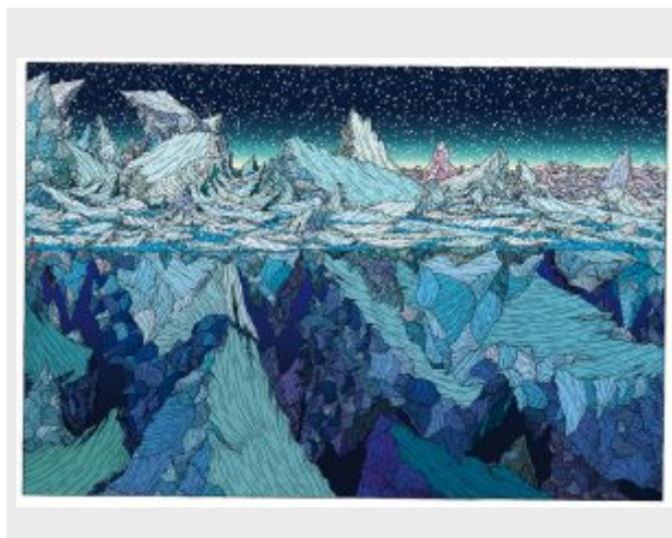
C. Vuillier, couverture de Reliefs n°3, paysage polaire 1 .

Pour renforcer l'aspect très esthétique de l'objet, le titre, le thème du dossier et le sommaire sont présentés sur un bandeau mobile, qui devient un poster une fois déplié, offrant ainsi un support-compagnon au numéro de la revue pour une infographie en grand format (qui aurait tout à fait sa place dans une salle de cours...). Le numéro, ainsi démuné de son bandeau, devient un objet plutôt artistique.