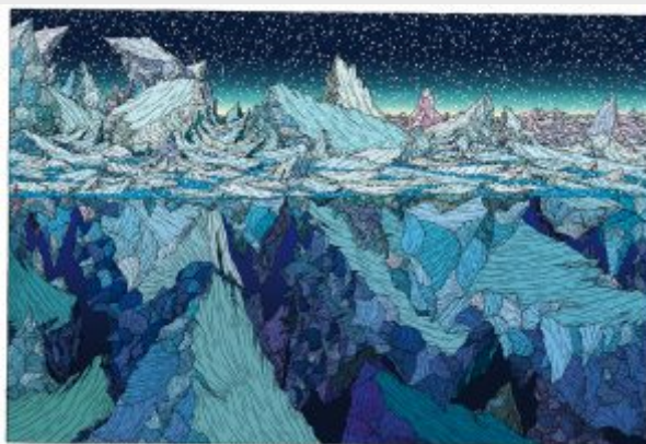
C. Vuillier, couverture de Reliefs n°3, paysage polaire 1 .

Pour renforcer l'aspect très esthétique de l'objet, le titre, le thème du dossier et le sommaire sont présentés sur un bandeau mobile, qui devient un poster une fois déplié, offrant ainsi un support-compagnon au numéro de la revue pour une infographie en grand format (qui aurait tout à fait sa place dans une salle de cours...). Le numéro, ainsi démuné de son bandeau, devient un objet plutôt artistique.