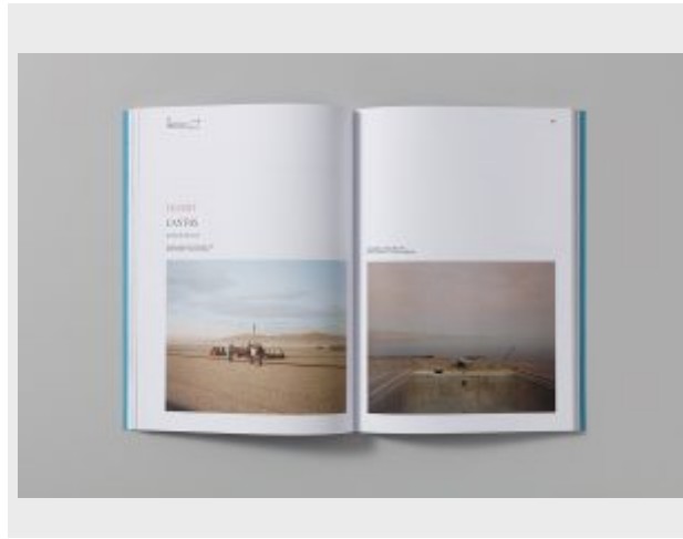
Portfolio, « Desert Cantos » de R. Misrach, Reliefs n°5.

Jeanne Baret...), de présentations d'archives photographiques ou de gravures (Edward Sheriff Curtis et les amérindiens au début du XX e siècle, les croquis de voyage de Louis de Freycinet...). On trouve ensuite un extrait assez long d'une œuvre littéraire (Jules Verne, Henry Morton Stanley, Herman Melville, ...).